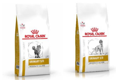
Croquettes Urinary Chats et chiens