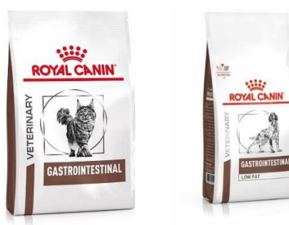
Croquettes Gastro Chats et chiens

Où les trouver ? Magasins spécialisés : Maxi zoo, Tom&Co Sites internet : Zooplus, La compagnie des animaux, Zoomalia